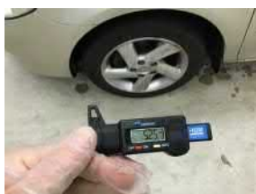
левая передняя шина