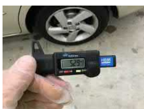
задние левые шины