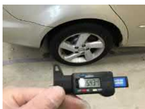
заднее правые шины