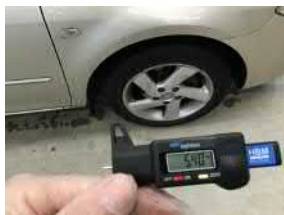
передние правые шины